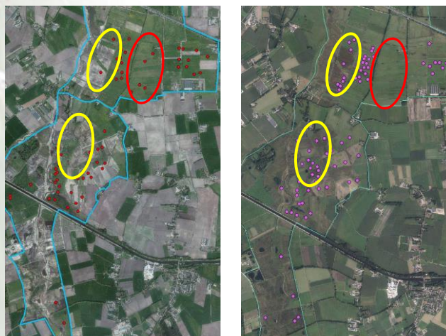
Figuur 3: Gruttoterritoria in 2011 1

Wat vooral opvalt is dat de weidevogels zich veel gelijkmatiger over het gebied zijn gaan vestigen.