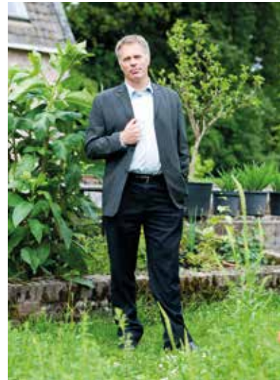
Hank Bartelink Landschappen NL (voorheen De12Landschappen)